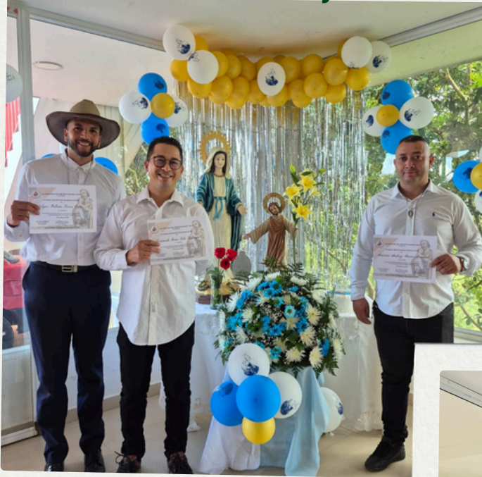
Ceremonia 24 de mayo de 2025